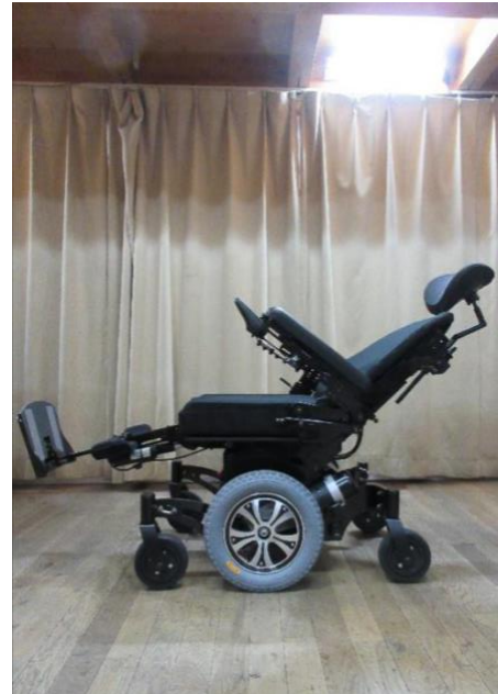
リクライニング （レッグサポートアップ）