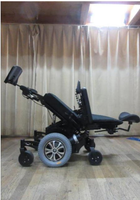
ティルト+リクライニング （レッグサポートアップ）