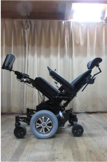
ティルト （レッグサポートアップ）

レルミニ・Tタイプ（レッグサポート付き）のできる姿勢 （機能を複数使うことでできる身体を休める姿勢）