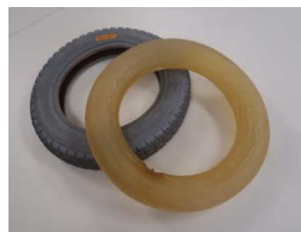
リペアムゲルタイヤ