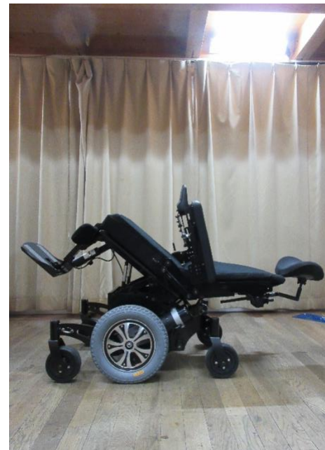
ティルト+リクライニング （レッグサポートダウン）