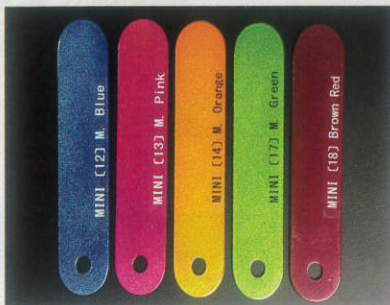
5色取り揃えています。