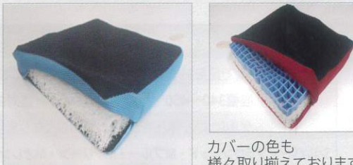
カバーの色も様々取り揃えております。

体圧分散性と通気性に優れた素材で、夏でも汗の課題を解決しました。セグメントの組み合わせもあります。