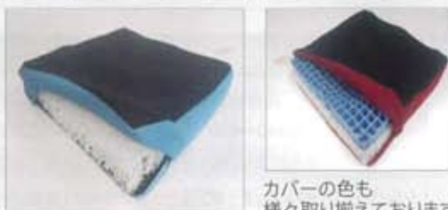
カバーの色も様々取り揃えております。

体圧分散性と通気性に優れた素材で、夏でも汗の課題を解決しました。セグメントの組み合わせもあります。