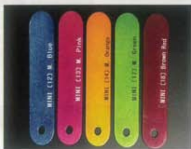
5色取り揃えています。